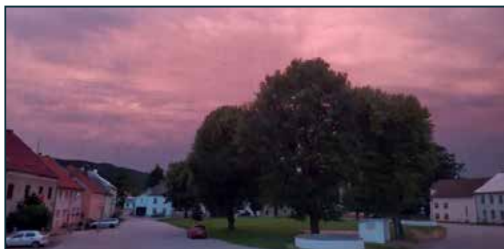
Úžasný letní večer - obloha nad „Horňákem“

28. 7 2020 kolem 21. hodiny.