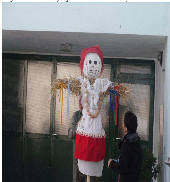
kousek „létečka „ (symbol jara, který má

spálit. U rybníčka za vsí Pod Lavičkou, jsme ji i my spálili, vytáhli jsme klobásky, buřtíky a lehce poobědvali. Děvčata natrhala větvičky, které jsme ozdobily pentlemi a každý účastník si